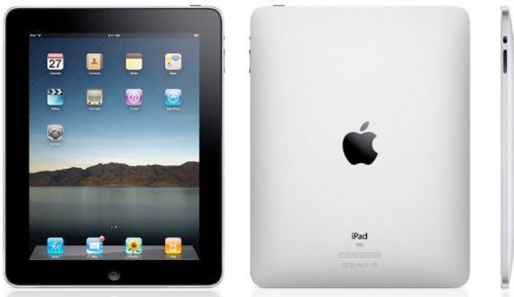
L'iPad, la tablette dévoilée par Apple le 27 janvier 2010