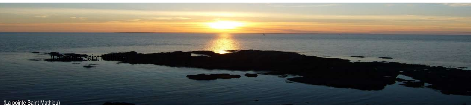
(La pointe Saint Mathieu)

Grâce au mécénat des Caisses d'épargne et de la Marine nationale, le navire est restauré et peut reprendre la mer en 1980 en tant que voilier-école ouvert à tous.