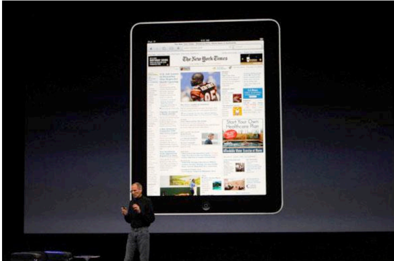
Steve Jobs dévoile l'iPad, la nouvelle tablette d'Apple, San Francisco, le 27 janvier 2010.